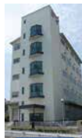
R & D