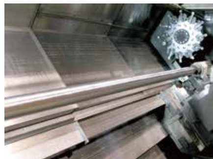
シャフトの切削加工(L/D=70以上)